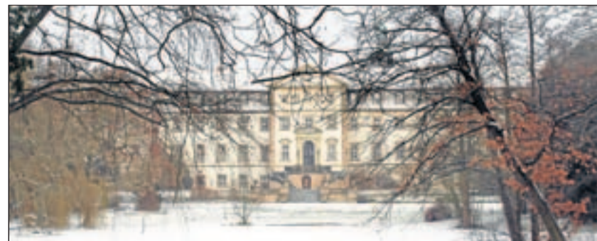
Blick vom winterlichen Park auf Schloss Ringelheim.

1817 kauft Baron Friedrich von der Decken das Gebäude samt Gut und Vorwerk für 200 000 Taler. Seine Blütezeit erlebt es unter dessen Sohn Graf Adolf von der Decken. Der lässt zwischen 1846 und 1848 von den Ringelheimern nach eige-