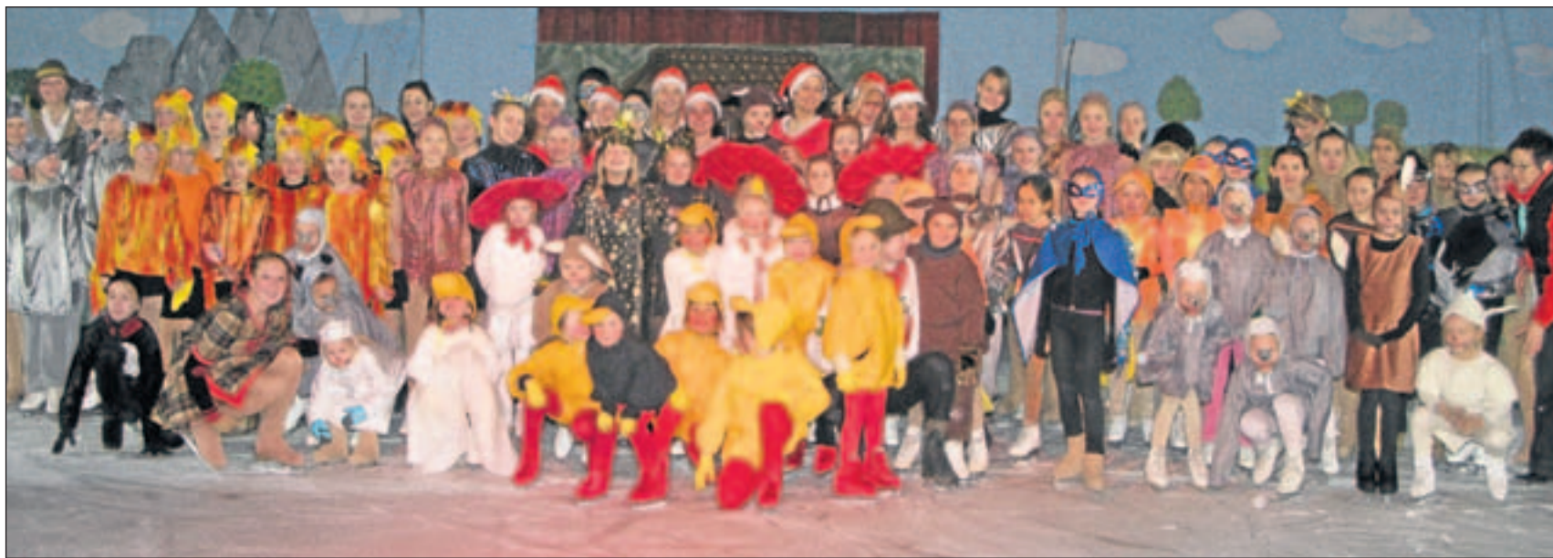
130 junge Eiskunstläufer des Berliner Schlittschuhverbandes führten gestern das Märchen „Hänsel und Gretel“ in der Eissporthalle auf.

GEBHARDSHAGEN. Nur für eine halbe Stunde hatte am frühen Freitagabend eine Frau ihr Reihenhaus an der Legdenwiese verlassen. Auch von ihrem Hund ließ sich ein unbekannter Einbrecher nicht abschrecken. Er hebelte die Terrassentür auf und durchwühlte Schränke im Erd- und Obergeschoss. Laut Polizei steht noch nicht fest, ob etwas gestohlen wurde.